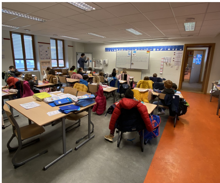
La classe de CP/CE1 bilingue B