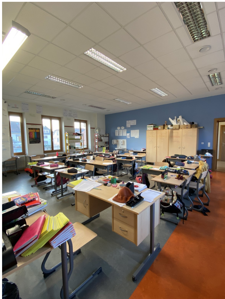
La classe de CM1 A