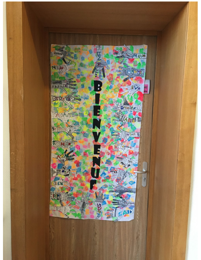
Les portes d'entrée des classes