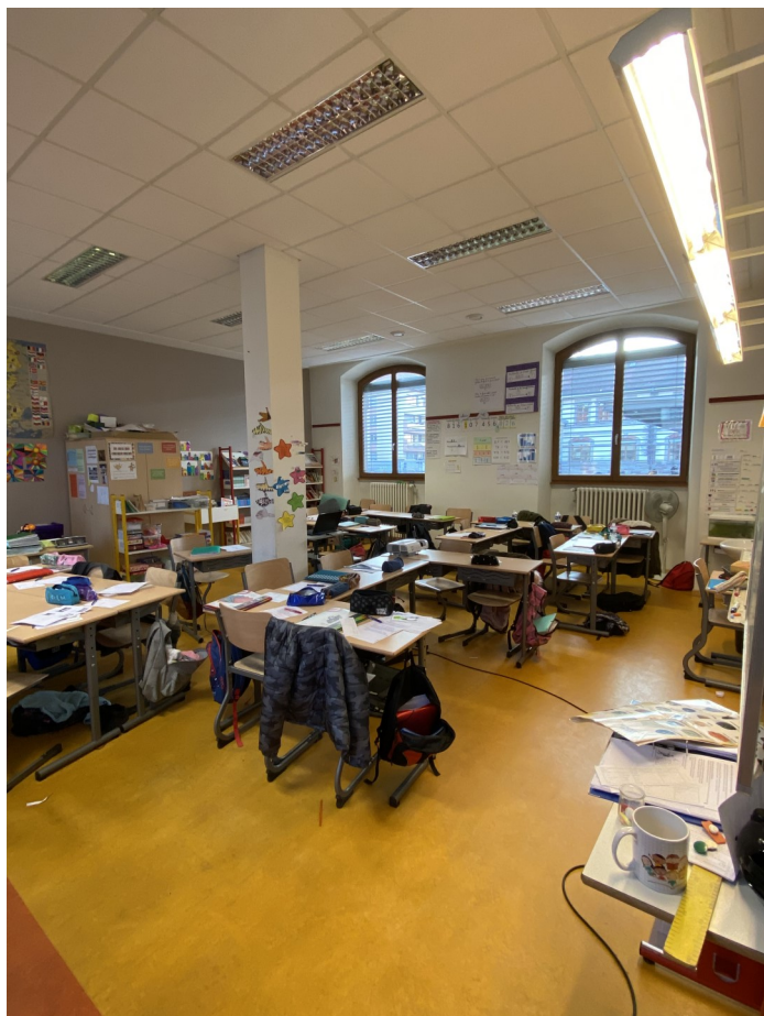
Classe de CM2