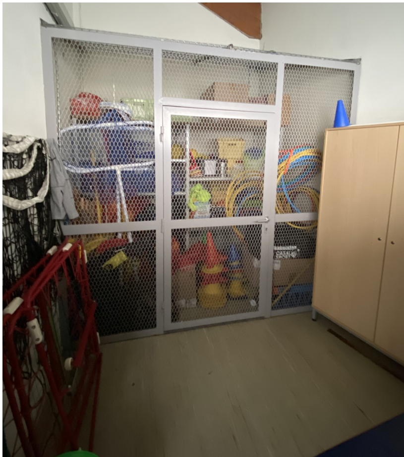
La réserve de matériel