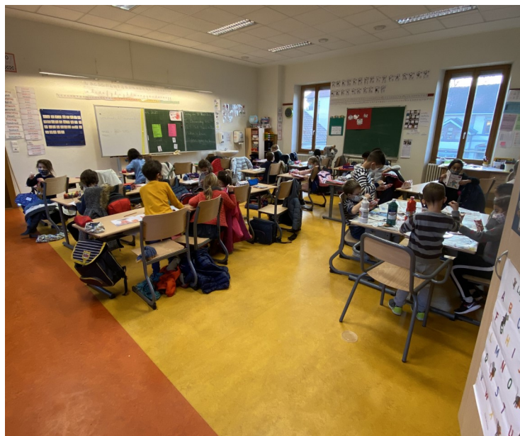
La classe de CP/CE1 bilingue A