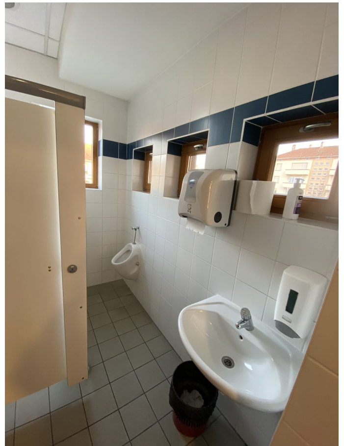
Les toilettes au demi-palier