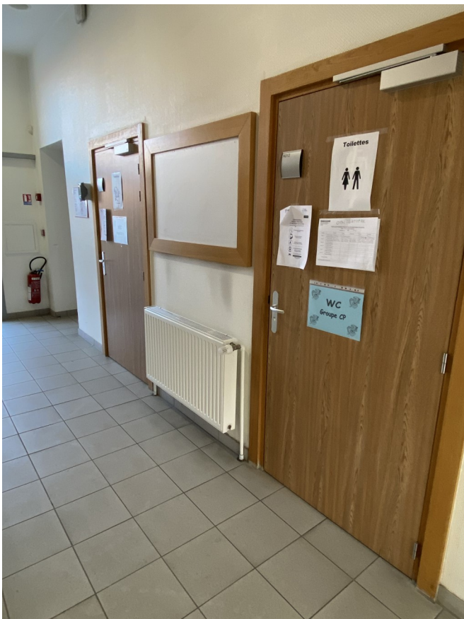
Les couloirs du rez-de-chaussée