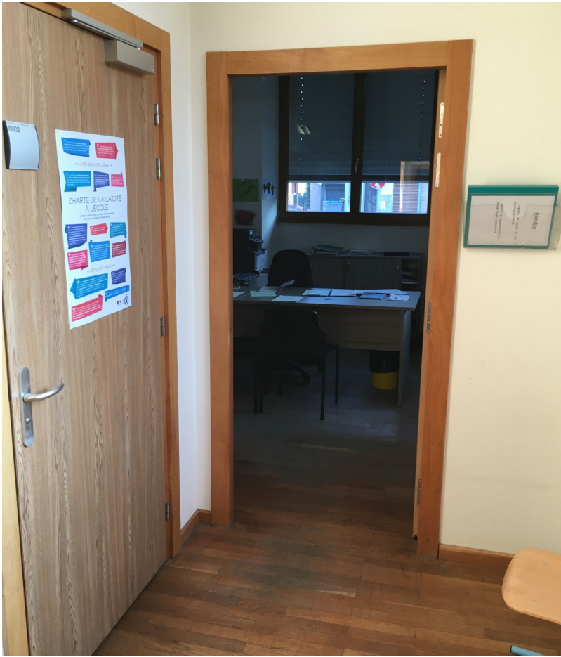
Le bureau du directeur