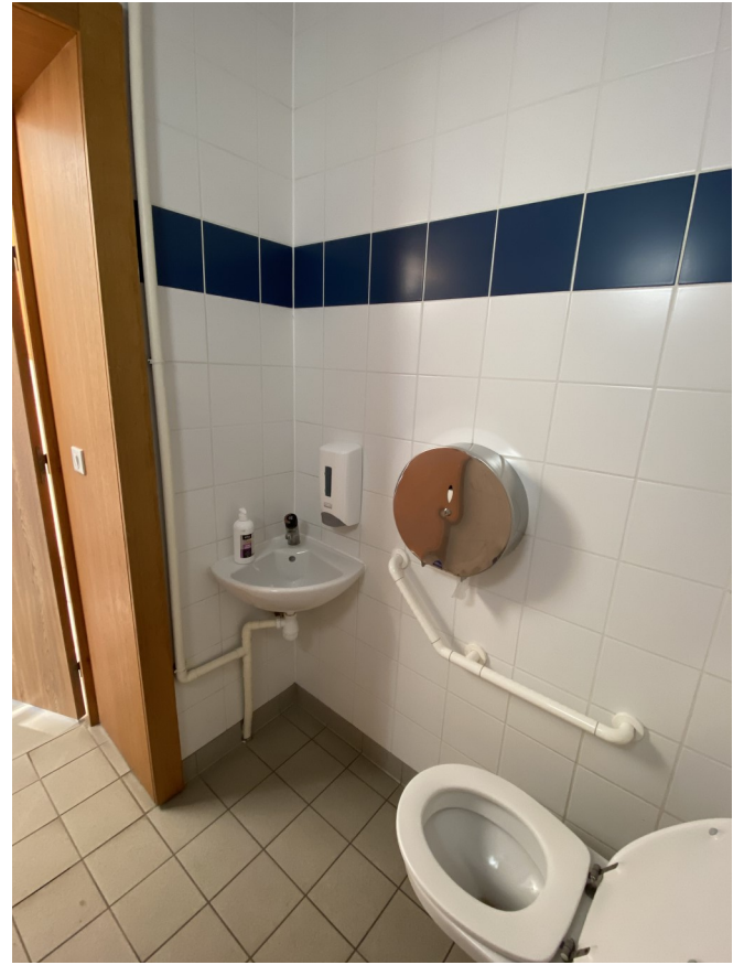
Les toilettes du RDC