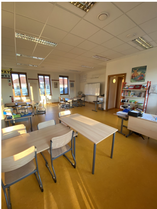
RASED E: Mme Bouillot