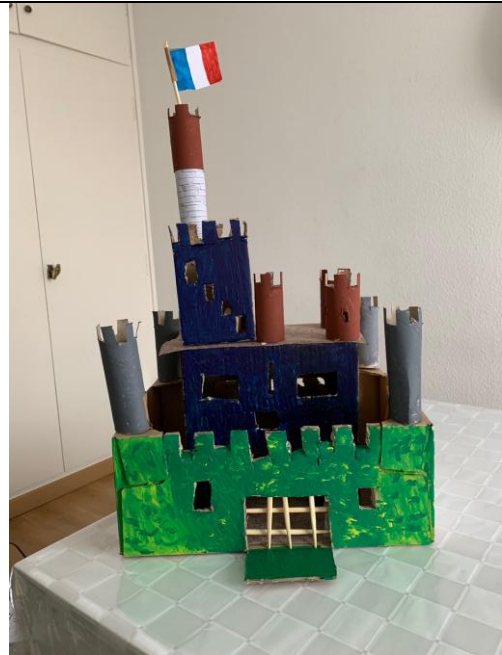
Le château fort de Dame Léa