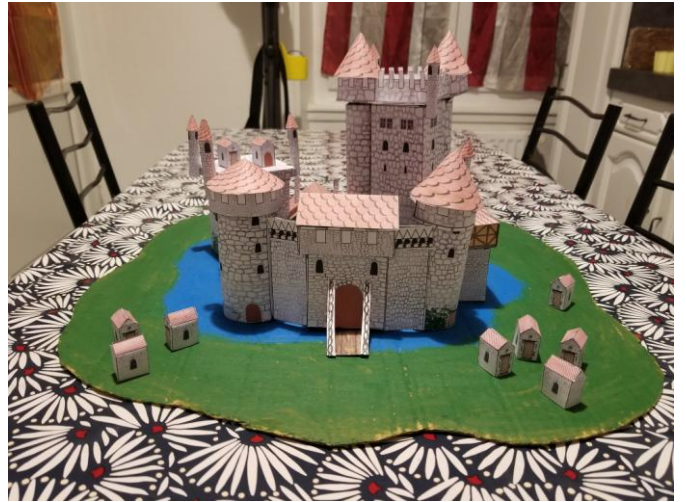
Le château fort du sieur Isam