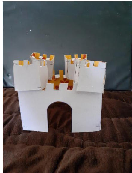
Le château fort du chevalier Abderahman