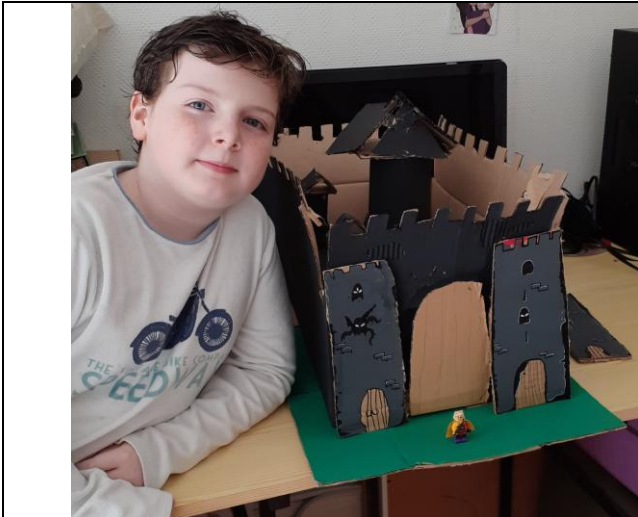
Le château fort du chevalier Elyo