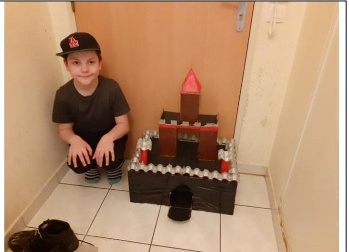
Le château fort du sieur Mayron