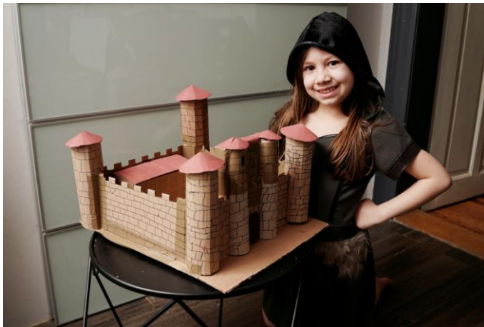
Le château fort de Damoselle Mona