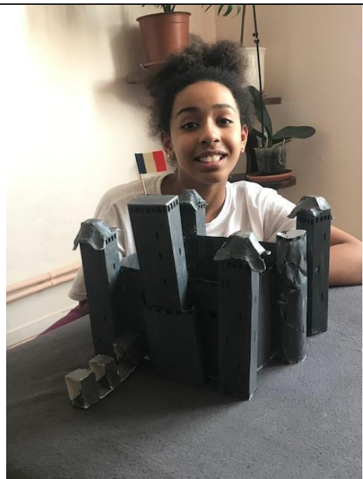
Le château fort de Dame Marie